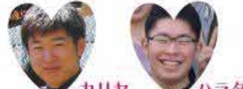
元保育園の栄養士 パティシエの資格有